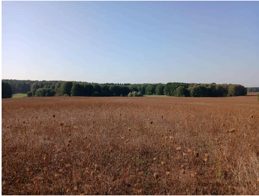
Blick über eine Teilfläche im Süden, September 2024