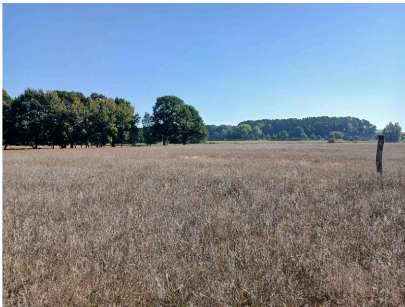
Blick über eine Teilfläche im Norden, September 2024

Das Ökokonto „Müritzboden“ befindet sich im Landkreis Mecklenburgische Seenplatte ca. 15 km nordöstlich der Stadt Mirow.